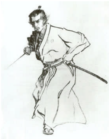
Der Weg des Samurai im modernen Leben. www.mondflieger.de