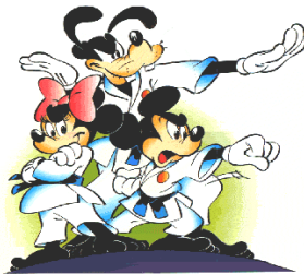
Karate für die ganze Familie während der selben Trainingszeit

Diese Frage beantwortet das Karatetraining selbst.